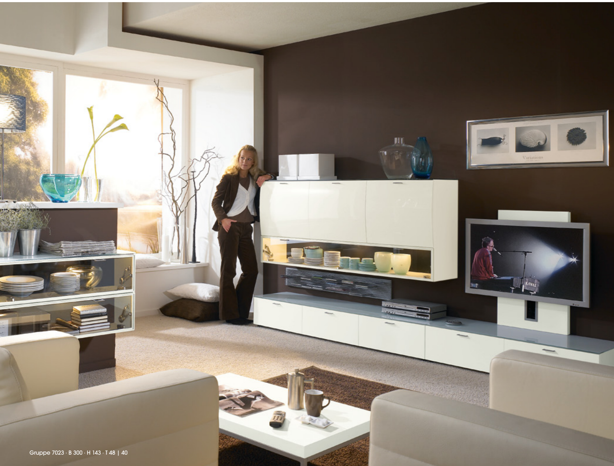
Gruppe 7023 · B 300 · H 143 · T 48 | 40