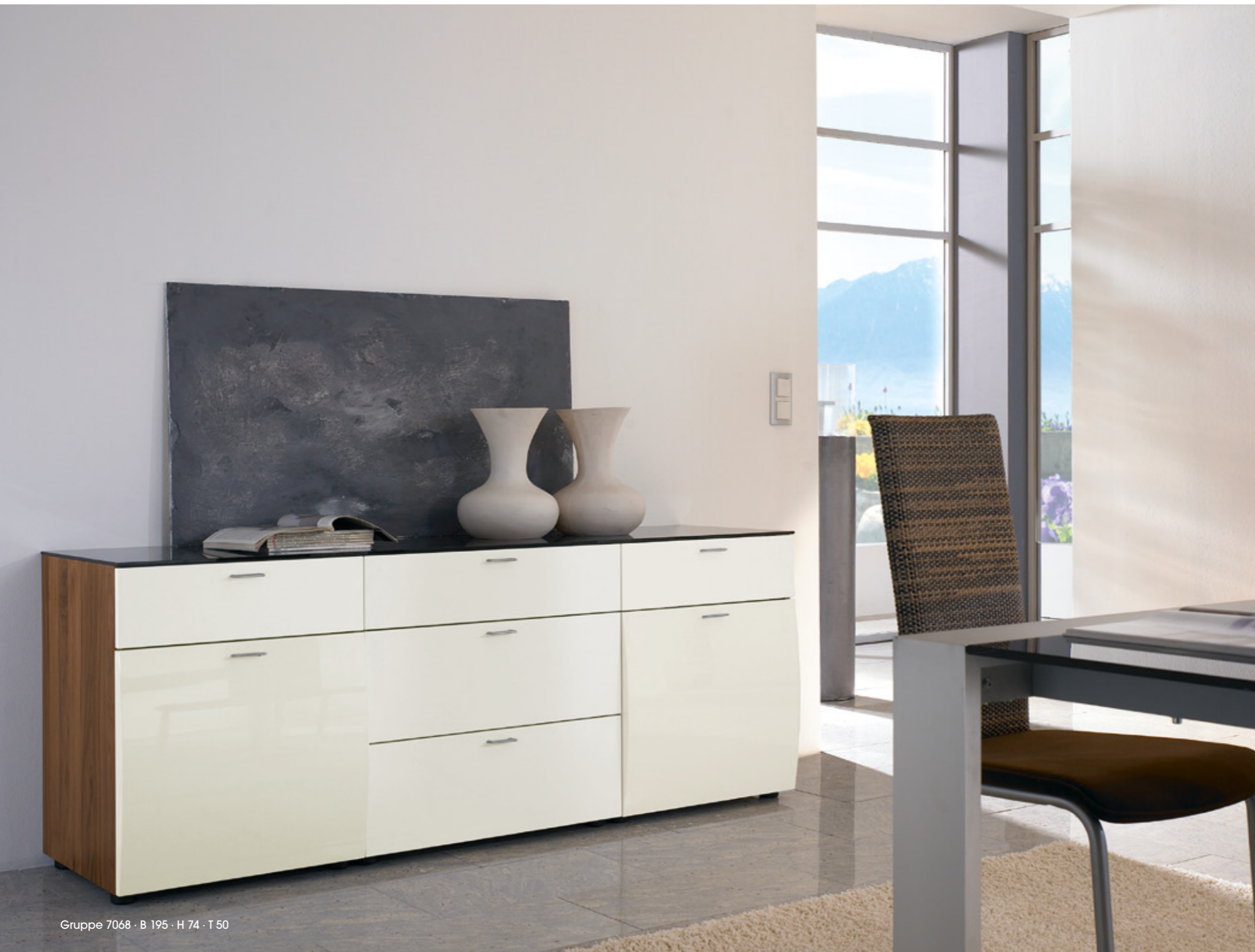
Gruppe 7068 · B 195 · H 74 · T 50