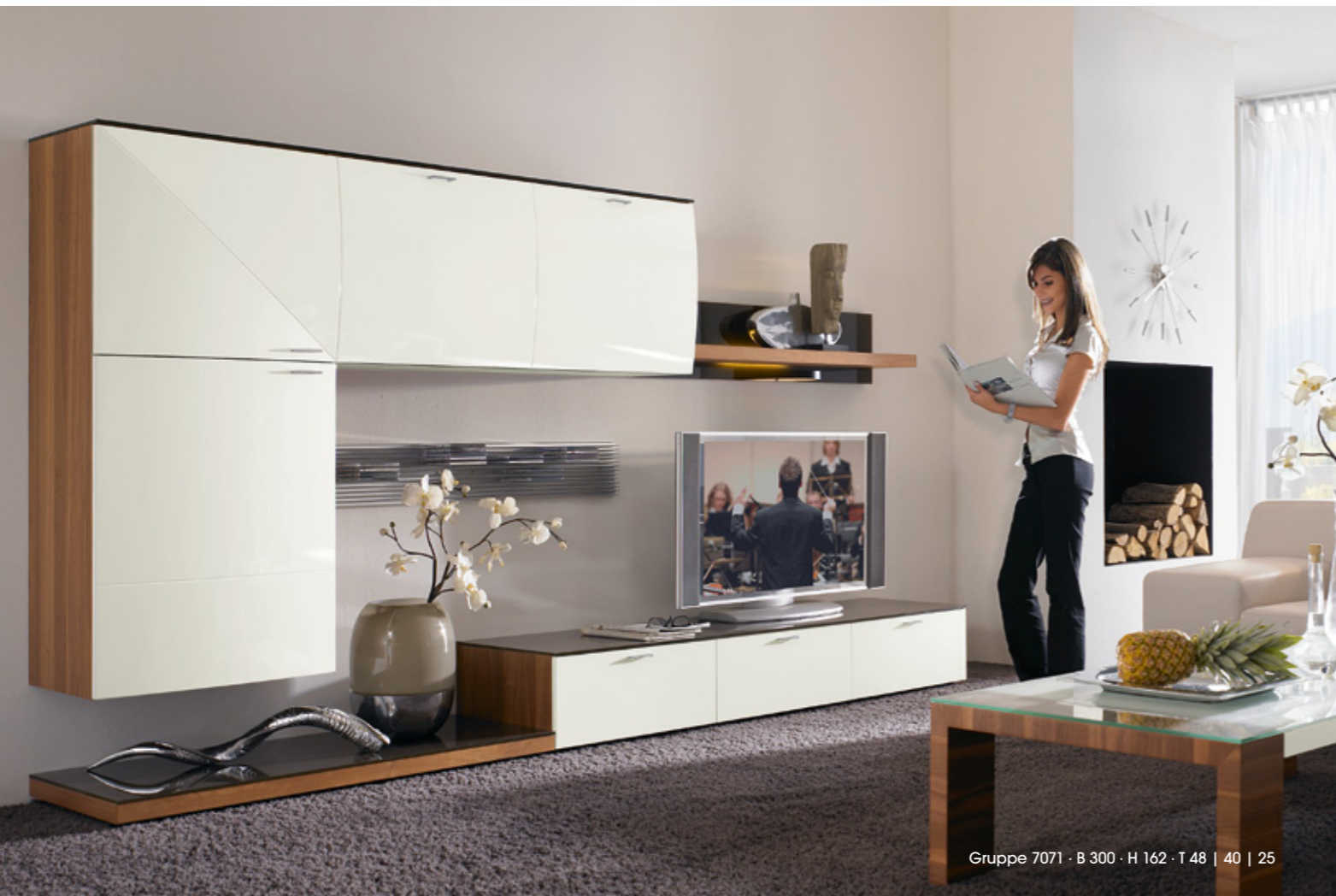
Gruppe 7071 · B 300 · H 162 · T 48 | 40 | 25