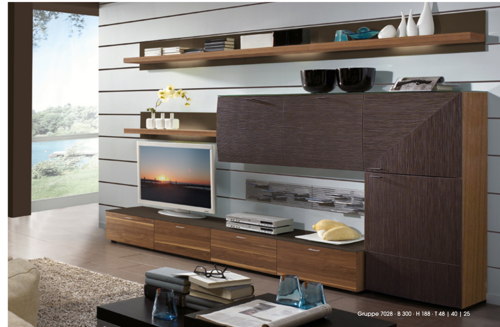
Gruppe 7028 · B 300 · H 188 · T 48 | 40 | 25