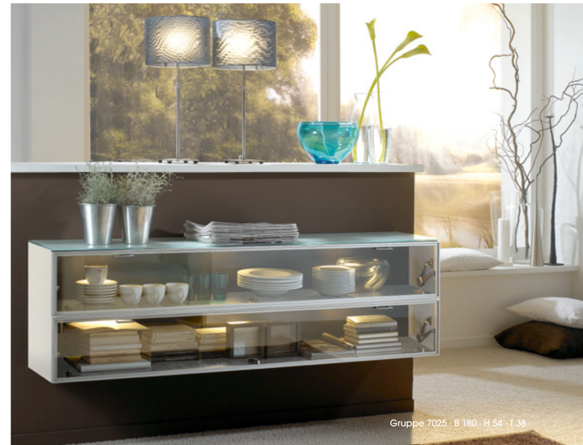
Gruppe 7025 · B 180 · H 54 · T 38