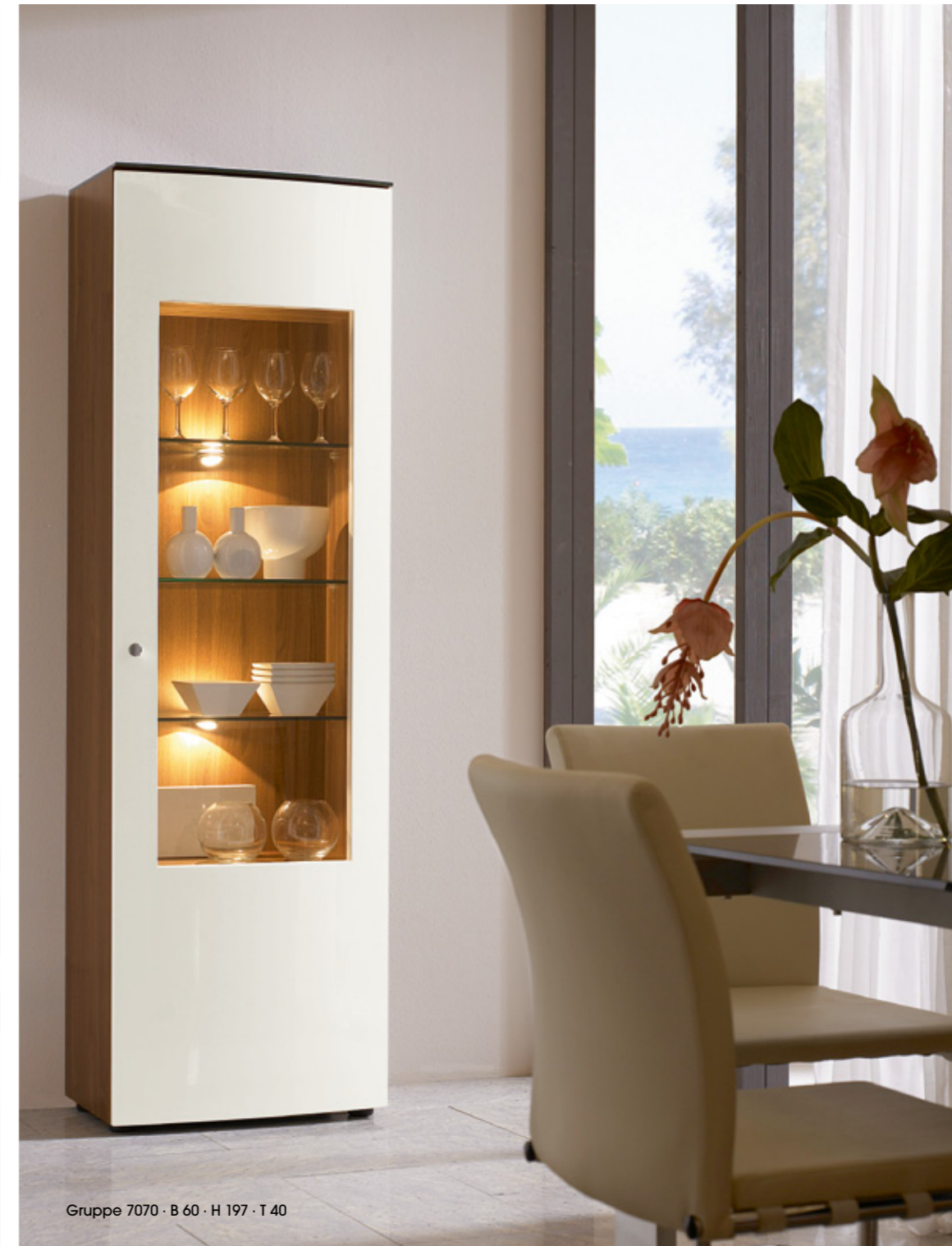
Gruppe 7070 · B 60 · H 197 · T 40