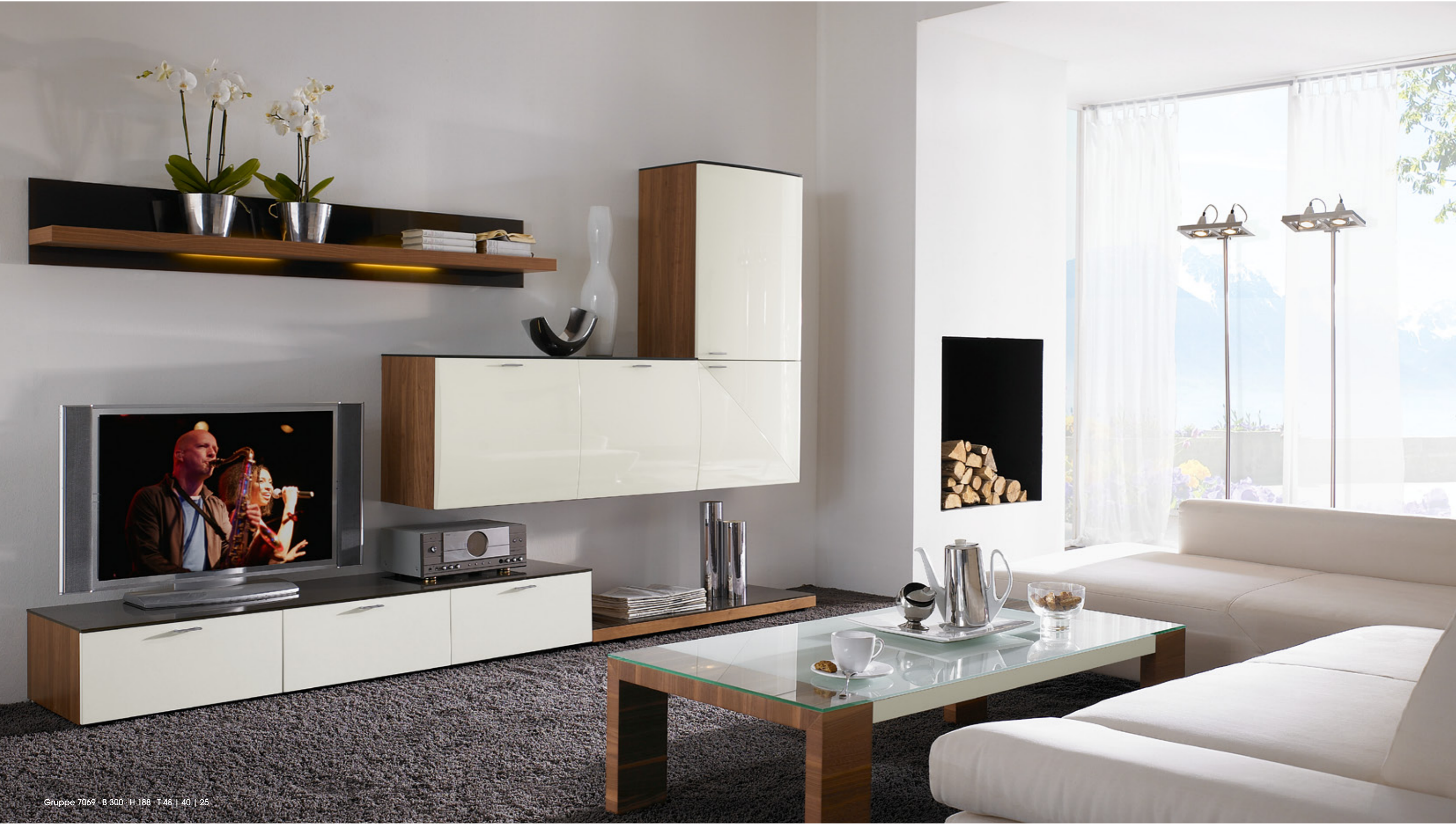
Gruppe 7069 · B 300 · H 188 · T 48 | 40 | 25