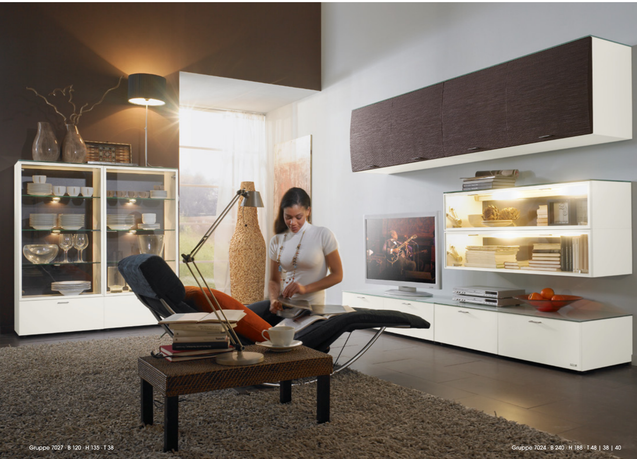
Gruppe 7027 · B 120 · H 135 · T 38