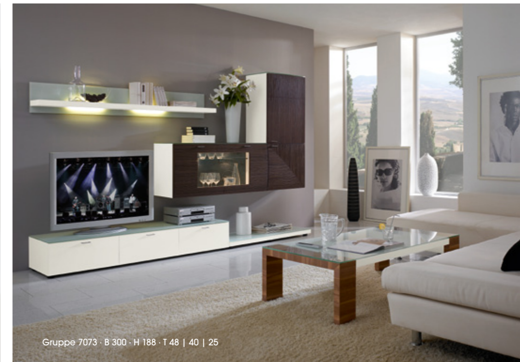
Gruppe 7073 · B 300 · H 188 · T 48 | 40 | 25

Innovative Beschlagtechnik bei Tür-Scharnieren und verdeckten Schubkastenführungen mit Selbsteinzug ermöglichen ein sanftes, abgedämpftes Schließen von Türen und Schubkästen.